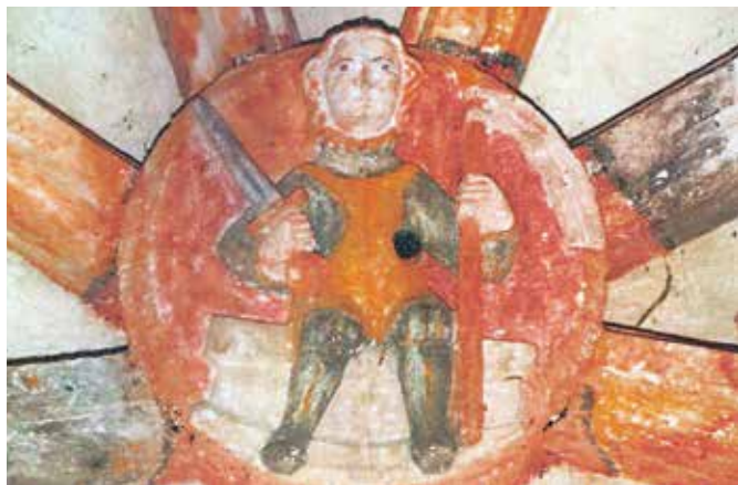
Schluss-Stein mit der Darstellung des hl. Hippolyt in der Burgkapelle von Burg Vichtenstein.