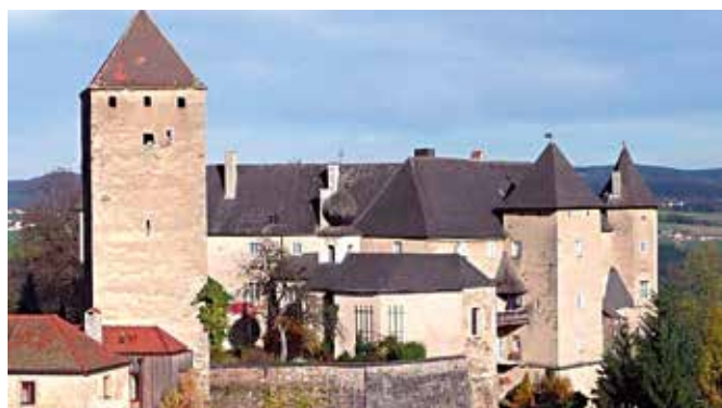
Die prachvolle, mittelalterliche Burg Vichtenstein nahe Schärding in Oberösterreich.

Herr DI Klaus Schulz-Wilkow hat mir dankenswerterweise das Foto vom Schluss-Stein für unsere Pfarre 3 -Ausgabe zur Verfügung gestellt, damit wird die Bedeutung unseres Kirchen- und Stadtpatrons bestätigt, da mit dieser Entdeckung bewiesen ist, wie weitläufig der Hippolyt-Kult in der Frühkirche war.